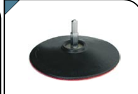
Диск шлифовальный С липучкой. Для дрели. Предназначен для крепления наждачных кругов.