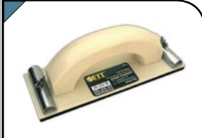
Тёрка для шлифования Для наждачной бумаги. Используется при обработке плоских поверхностей. Материал: пластик, с металлическим прижимом.