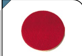
Круг фетровый С липучкой. Для финишной обработки.