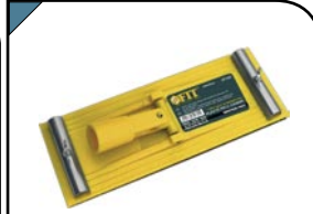
Держатель для наждачной бумаги Для обработки плоских поверхностей. Под телескопический стержень. Материал: пластик.