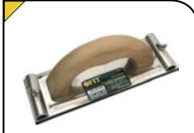
Тёрка для шлифования Для наждачной бумаги. Используется при обработке плоских поверхностей. Материал: алюминий, с металлическим прижимом, деревянная ручка.