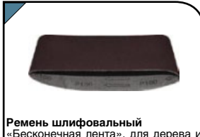
Ремень шлифовальный «Бесконечная лента», для дерева и металла. На тканевой основе. Водостойкий. Для ленточношлифовальных машин. 457x75 мм. Набор 5 шт. Материал: хлопок, алюминий-оксидный абразивный слой.