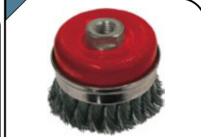
Корщетка-насадка Тип «чашка», с металлическим бандажом, гайка М14. Для шлифовальных и отрезных машин. Витая стальная проволока.