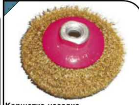
Корщетка-насадка Тип «колесо», с наклоном, гайка М14. Для шлифовальных и отрезных машин. Материал: стальная, латунированная, волнистая проволока.