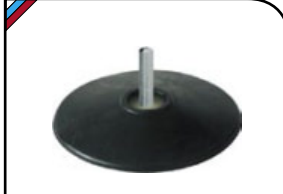
Диск шлифовальный Для крепления шлифовальных кругов. Для дрели. Материал: резиновый усиленный диск, штифт из алюминиевого сплава.