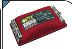
Держатель для наждачной бумаги Для обработки плоских поверхностей. С металлическим прижимом. Материал: ABS противоударный пластик, с металлическим прижимом.