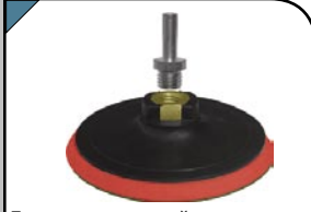
Диск полировочный Полировочная поверхность из грубой ткани. Гайка М14 для крепления на шлифовальные и отрезные машинки. В комплект входит переходник со штифтом из инструментальной стали для крепления на дрель.