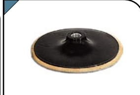
Диск шлифовальный С липучкой, гайка М14. Для шлифовальных и отрезных машин. Предназначен для крепления наждачных кругов.