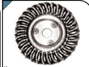
Корщетка-насадка Тип «колесо». Для шлифовальных и отрезных машин. Витая стальная проволока. Посадочный d=22 мм.