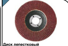
Диск лепестковый Для углошлифовальных машин. Посадочный диаметр 22 мм.