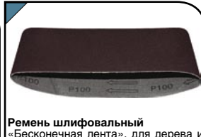
Ремень шлифовальный «Бесконечная лента», для дерева и металла. На тканевой основе. Водостойкий. Для ленточношлифовальных машин. 533x75 мм. Набор 5 шт. Материал: хлопок, алюминий-оксидный абразивный слой.