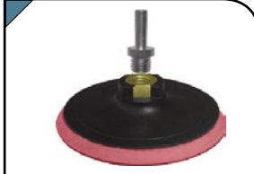
Диск полировочный Шлифовальный диск с липучкой, пластиковая основа. Гайка М14 для крепления на шлифовальные и отрезные машинки. В комплект входит переходник со штифтом из инструментальной стали для крепления на дрель. Предназначен для крепления наждачных кругов.