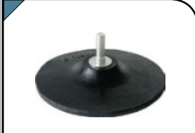
Диск шлифовальный Для крепления наждачных кругов. Для дрели. Материал: резиновый диск, штифт из алюминиевого сплава.