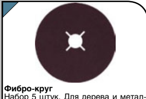
Фибро-круг Набор 5 штук. Для дерева и металла. Используются со шлифовальными дисками. Без липучки. D=125 мм. Материал: алюминий-оксидный абразивный слой, вулканизированная фибра.