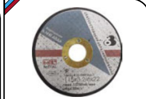
Диск зачистной Торцевой. Для углошлифовальных машин. Посадочный диаметр 22 мм.