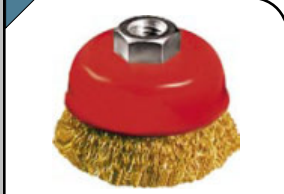
Корщетка-насадка Тип «чашка», гайка М14. Для шлифовальных и отрезных машин. Стальная латунированная, волнистая проволока.