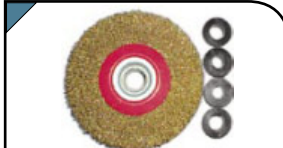
Корщетка-насадка Тип «колесо». С резиновыми адаптерами на разные посадочные диаметры. Для шлифовальных машин. 39012 - адаптеры: 5/8", 1/2". 39015 - адаптеры: 1", 1/2", 5/8", 7/8", 3/4". По 2 штуки каждого типа. Материал: стальная, латунированная, волнистая проволока.