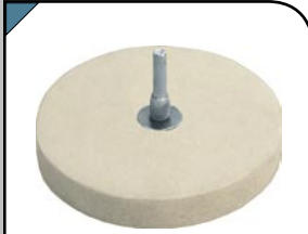
Круг полировочный Фетровый. Используется для полировки металлических поверхностей.