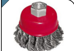
Корщетка-насадка Тип «чашка», гайка М14. Для шлифовальных и отрезных машин. Витая стальная проволока.