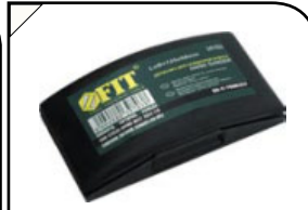
Держатель для наждачной бумаги Для обработки плоских поверхностей. Игольчатый фиксатор для быстрой смены наждачной бумаги. Материал: резина.